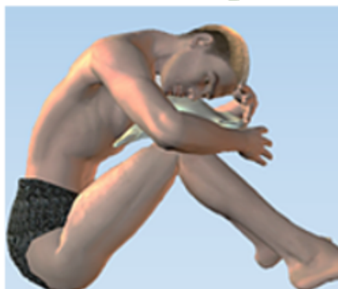
Posição de Blechman Típico de pericardite