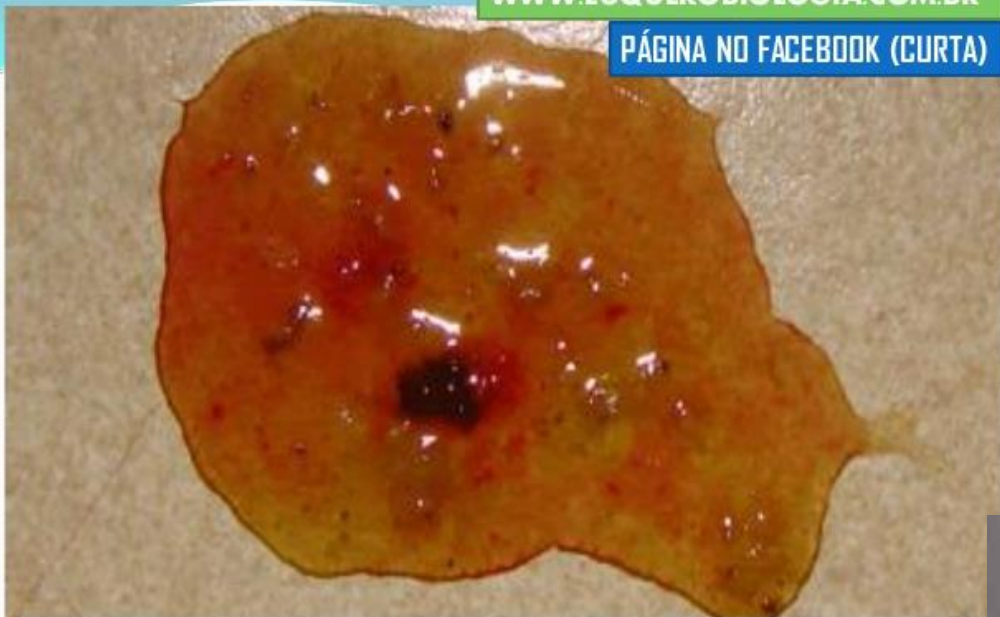
Fezes diarréicas com muco intenso e sangue (sinais de irritação do intestino grosso causada por leve infestação de Giardia) em cão. Nota: as fezes de um cão infestado pela giardia poderá ter muco com coloração incolor, amarelada e esverdeada.